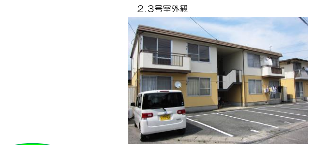
1階バルコニー無し